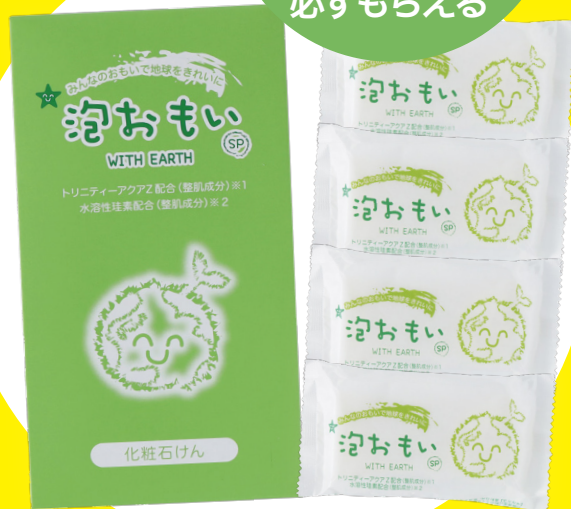
※WEB登録後、1ヶ月以内に必要書類をご提出された方が対象

7月・8月限定の特典付きトライアル登録キャンペーンが開催中です！ 「泡おもい」石けん20個プレゼント、必要書類、手続きも簡単。今始めれば、 9月以降の顧客フォロー体制も万全です。