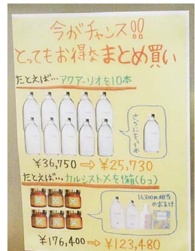
▲もちろんケースもお勧めします!