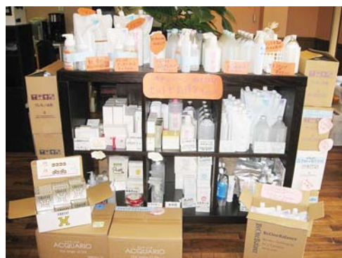
▲単品からケースまでずらっと一式