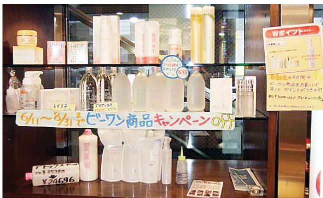
▲商品展示コーナーもキャンペーン色