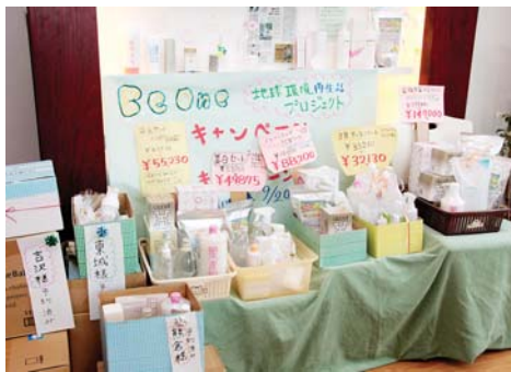
▲カラフルで目に留まるからお客様の反響も◎