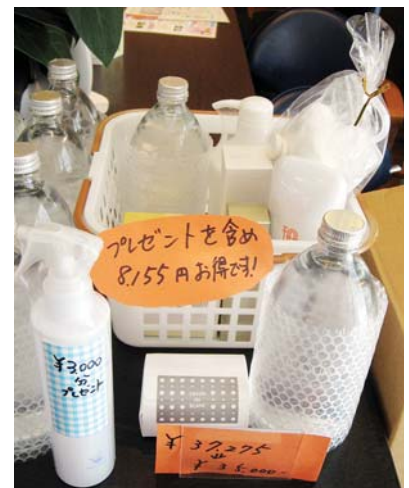
▲いくらお得かわかるところがポイント