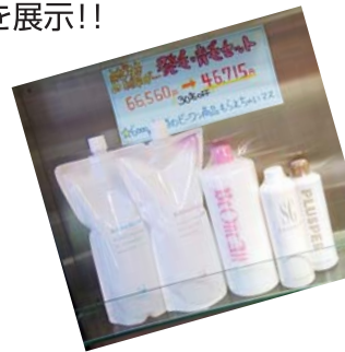
▲わかりやすいPOPに商品展示