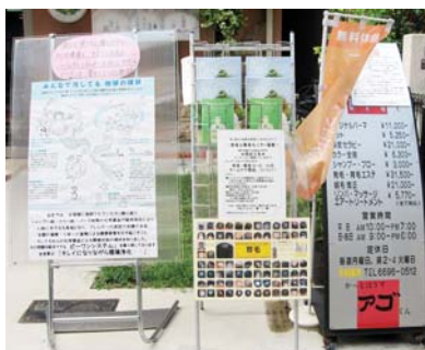
▲お店の外にもビーワンをPR